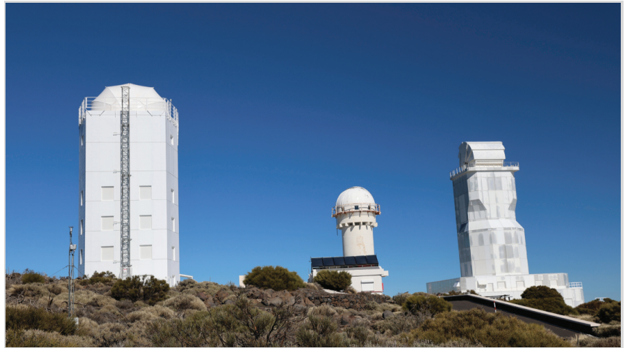
Abb. 6: Die beiden großen Sonnentelkope GREGOR und VTT (von links nach rechts).

THEMIS ist ein Heliograph-Teleskop, das zur Erforschung des Magnetismus und der Instabilitäten auf der Sonne vom Observatorium Meudon-Paris entwickelt wurde. Es besitzt einen Durchmesser von 90 cm und ermöglicht es, die Intensität und Ausrichtung des Magnetfeldes der Sonne zu untersuchen. Eine der Charakteristiken von THEMIS ist seine Fähigkeit, simultan auf verschiedenen Banden zu operieren. Darüber hinaus ist es mit THEMIS möglich, experimentelle Daten über die Atmosphäre der Sonne in