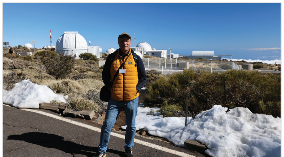
Abb. 5: Auf dem Gelände des Observatorio del Teide.

die Dynamik, Struktur und chemische Zusammensetzung der Atmosphäre der Sonne zu untersuchen, sowie Erkenntnisse über die Granulierung der Sonne zu gewinnen. Für diese Art von Beobachtungen, die eine hohe räumliche Auflösung verlangen, verfügt es über einen „Solarkorrelator“. Dieses Instrument ist das einzige seiner Art und wurde vom Institut für Astrophysik der Kanarischen Inseln entwickelt. Das robotische Teleskop ChroTel ist zusätzlich am VTT installiert worden, um den Überblick über die gesamte Sonnenscheibe als Vergleich zu bekommen. Als Vakuumteleskop besitzt es im Inneren keine Luft, damit der Brennpunkt im Vakuum liegt. So können Bildunruhen durch Aufheizung vermeiden und durch eindringende Wärmestrahlung keine Luftturbulenzen erzeugt werden. Konzipiert wurden das VTT und seine Postfokus-Instrumente in den 1970er-Jahren, als der photographische Film noch das Aufzeichnungs- und Archivierungsmedium der Wahl war. Daher waren drei Dunkelkammern integriert. Das VTT ist mit einem Primarspiegel von 70 cm Durchmesser und einem vertikalen Spektrographen von 15 m Länge ausgerüstet. Mit dem fest eingebauten Teleskop wird das Sonnenlicht über zwei bewegliche Coelostaten-Spiegel empfangen, die einen Durchmesser von 80 cm haben. Das Teleskop des VTT besteht