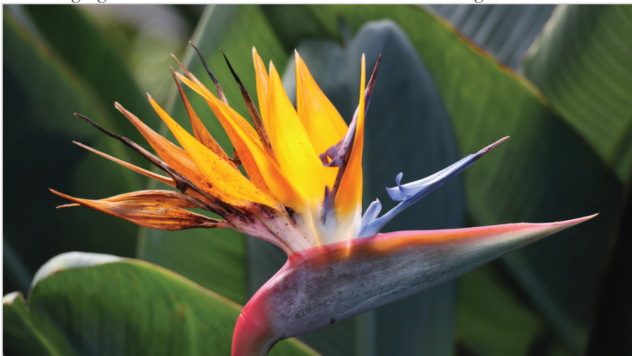
Abb. 3: Kanarische Strelitzie, die ihren Ursprung in Südafrika hat.

Besuch der Sonnentelkope Wenn man das Observatorio del Teide besichtigen möchte, sollte man sich beim Anbieter vor Ort Volcano Teide vor der Reise schon mal einen Besuchstermin sichern. Man kann zwar ohne Führung auch zu den Observatorien fahren, kommt dann aber nicht auf das Gelände. Über die Webseite des Anbieters ist eine Buchung