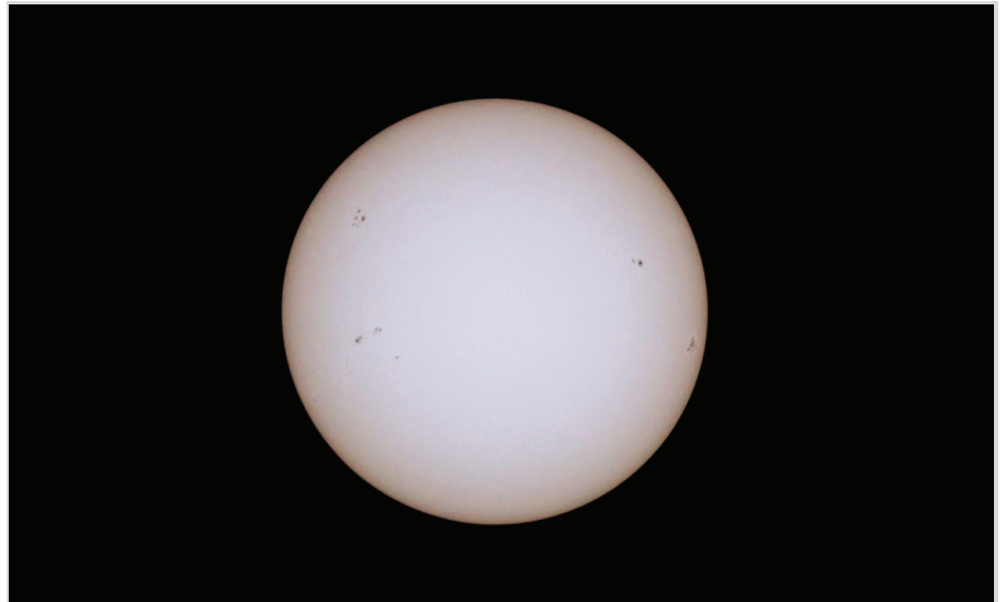
Abb. 9: Sonnenfleckengruppen der Sonne im Weißlicht.

i. SLOOH [13]: ist ein Remote-Teleskop von Slooh aus den USA für Amateurastronomen, das 2004 in Betrieb genommen wurde. Es ermöglicht dabei eine Live-Betrachtung durch ein Teleskop über das Internet und besitzt auf die da-