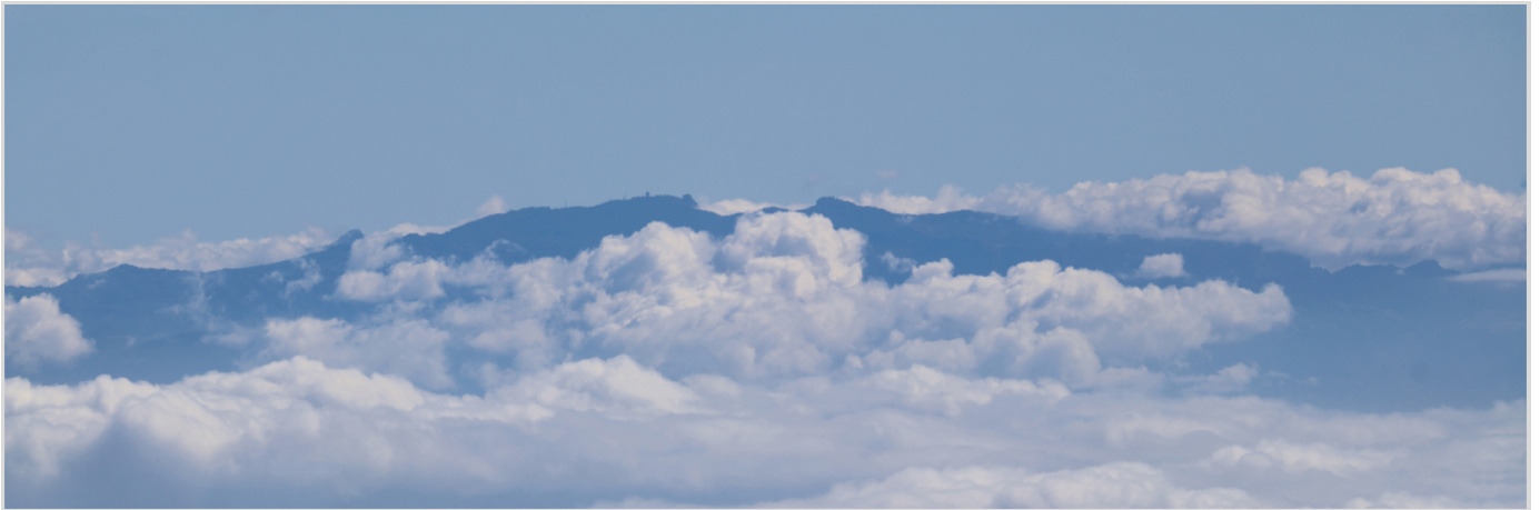
Abb. 13: Abschließender Blick vom Observatorio del Teide auf die gegenüberliegende Insel Gran Canaria.

Europas GREGOR ist eines davon, welches allerdings ab 2029 Konkurrenz durch das geplante European Solar Telescope (EST) bekommt. Dieses wird auf La Palma gebaut und einen 4,2-Meter-Spiegel besitzen. Da es vornehmlich die magnetische Kopplung der Sonnenatmosphäre untersuchen wird, kann es allerdings als Ergänzung zu GREGOR angesehen werden. Daher hat auch der Parallelbetrieb so vieler Teleskope durchaus seine Berechtigung.