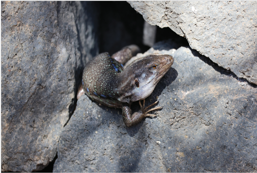
Abb. 4: Männliche Kanaren-Eidechse, die aus einer kanarentypischen Natursteinmauer lugt.

ohne Probleme möglich, so dass man mit einem Guide das Gelände betreten darf (siehe Abbildung 5). Als Sprache werden Spanisch, Englisch und Deutsch angeboten. Wir hatten eine nette Schweizerin als Begleitung, die uns als Gruppe mehrere Stunden dort herumführte. Dabei betritt man allerdings die Sonnenobservatorien nicht direkt, was wohl nur einmal im Jahr zur Sommersonnenwende zum „Tag der offenen Tür“ gestattet wird. Aber man läuft auf dem Gelände herum und darf sogar durch extra aufgebaute Sonnentelkope die Sonne selbst beobachten (siehe Abbildung 8). Beispielhaft wurde auch ein kleineres Observatorium besichtigt, um dort die Arbeiten vor Ort zu erklären. Im Dezember war es sehr ruhig vor Ort, da sich alle im Weihnachtsurlaub befanden. Aber das machte die Besichtigung nicht weniger interessant.