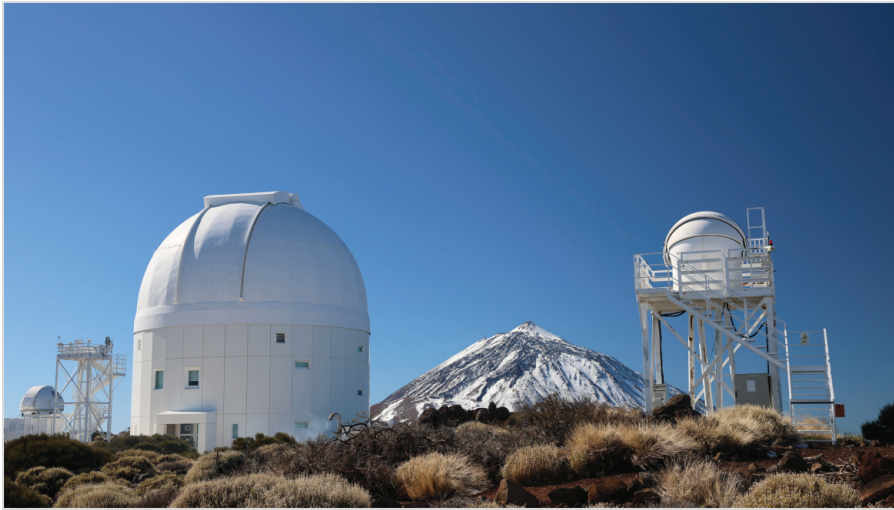
Abb. 10: Optical Ground Station (OGS) zur Beobachtung von Weltraumschrott und erdnahen Asteroiden.

ben und fertiggestellt, konnte dann aber nicht mehr an den russischen Auftraggeber ausgeliefert werden und sollte deswegen verschrottet werden. Das DLR sicherte sich vorerst das Eigentum am Teleskop, der Steuerelektronik und der Kuppel und suchte anschließend einen passenden Ort, um dieses Teleskop aufzubauen und betreiben zu können. Die Wahl fiel dann auf das Observatorio del Teide auf Teneriffa, da die Äquatornähe vorteilhaft für die Beobachtung von Satelliten in geostationären Umlaufbahnen ist. Das IAC erlaubte der ESA, dort das Teleskop aufzubauen und die Infrastruktur zu nutzen, im Austausch für 25 % der Beobachtungszeit. 1994 wurde mit dem Bau begonnen und vom spanischen König Juan Carlos 1996 eingeweiht. First Light war aber erst im Jahr 1997, da die eigentliche Nutzung für den ursprünglich geplanten Zweck der Laserkommunikation sich verzögerte. Am 15. November 2001 wurde zum ersten Mal das Signal vom Kommunikationssatellit Artemis aufgefangen und kurze Zeit später eine Datenverbindung aufgebaut. Das Teleskop kann außerdem per Laserlicht einen künstlichen Leitstern im Natrium-Band in der Mesosphäre projizieren und damit die übrigen Teleskope mit adaptiver Optik unterstützen. Im Jahr 2019 wurde die Station selbst mit einer adaptiven Optik ausgebaut und 2021 mit dem Satelliten