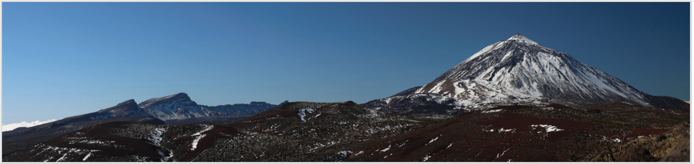
Abb. 11: Panoramabild des Pico del Teide mit dem Nationalpark.

Kerndurchmesser führt das Licht vom Teleskop zum Spektrographen. Das WIFSIPi-Instrument ist die großformatige CCD-Kamera und Photometer. Es bietet ein Gesichtsfeld von 22 x 22 Bogenminuten bei einem Abbildungsmaßstab von 0,32 Bogensekunden/Pixel. Der Detektor besitzt eine Größe von 4096 x 4096 Pixeln, mit einer Pixelgröße von 15 \mu\text{m} und einer Quanteneffizienz > 90 %, das vom Imaging Technology Laboratory (ITL) von der University von Arizona produziert wurde. Durch SES und WIFSIPi lassen sich daher gleichzeitig Spektrografie und Photometrie durchführen, um eine stellare Tomografie anfertigen zu können. Die Teleskope wurden 2006 eingeweiht und befinden sich seitdem in vollem robotischen Betrieb. Die Kernaufgabe von STELLA ist die Untersuchung der magnetischen Aktivitäten auf kühlen Sternen, einschließlich der Analyse von Sternflecken, Magnetfeldern und Rotationsperioden. Außerdem ist STELLA darauf spezialisiert, Planeten außerhalb unseres Sonnensystems zu entdecken, wenn diese vor ihren Sonnen vorbeiziehen (Transitbeobachtung). STELLA sammelt kontinuierlich Daten über aktive Sterne, was für das Verständnis der Sternentwicklung entscheidend ist.