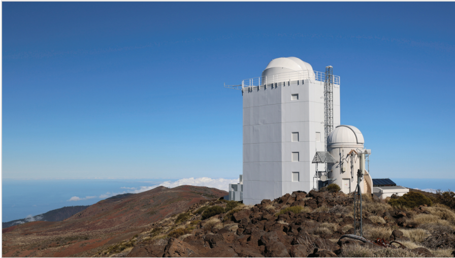
Abb. 7: Sonnenteleskop GREGOR – Europas größtes Sonnenteleskop.

Lichts wird dem Wellenfrontsensor zugeführt, um eine Echtzeitkorrektur der atmosphärischen Verzerrungen zu ermöglichen.