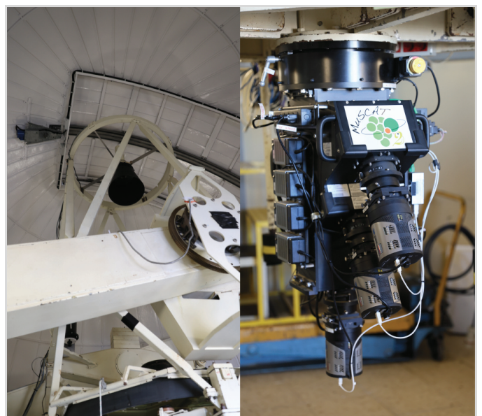
Abb. 12: Typische automatisierte Sternwarte auf dem Gelände des Observatorio del Teide.

Zusammenfassung Das Observatorio del Teide gehört zum Instituto de Astrofísica de Canarias (IAC) und bildet zusammen mit dem Roque-de-los-Muchachos-Observatorium auf La Palma das European Northern Observatory. Im Jahr 1964 wurde es gegründet. Durch die fortschreitende Besiedlung Teneriffas, die durch den zunehmenden Tourismus verursacht wurde, litten allerdings im Laufe der Zeit die anfänglich hervorragenden Bedingungen für die nächtliche Himmelforschung. Aus diesem Grund hat sich das Teide-Observatorium auf die Sonnenbeobachtung spezialisiert, die 24 Stunden täglich im kooperativen Verbund mit anderen Observatorien betrieben wird. Das größte Sonnenteleskop