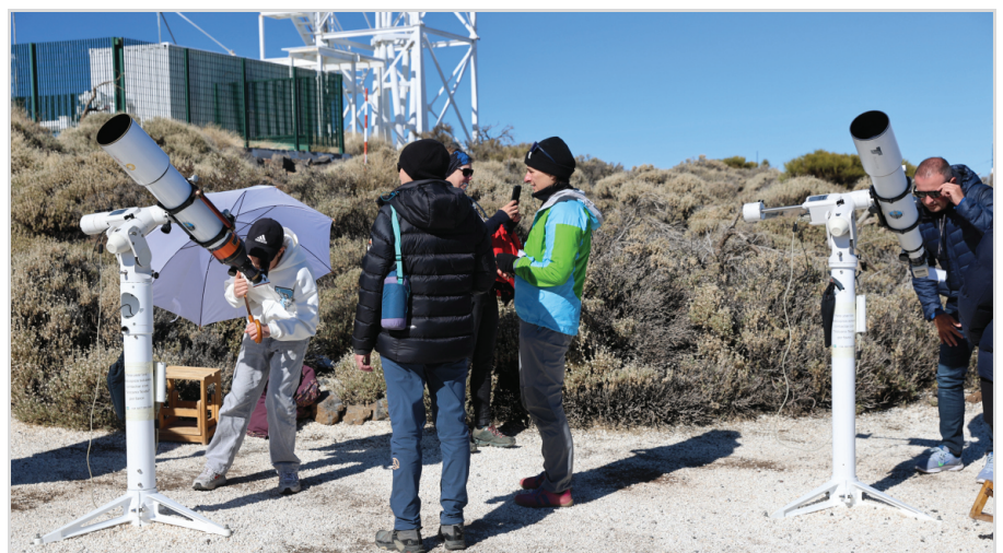
Abb. 8: Gemeinsames Beobachten der Sonne in H-Alpha und Weißlicht.

c. IAC-80-Teleskop [7]: besitzt einen 80-Zentimeter-Hauptspiegel und ist für