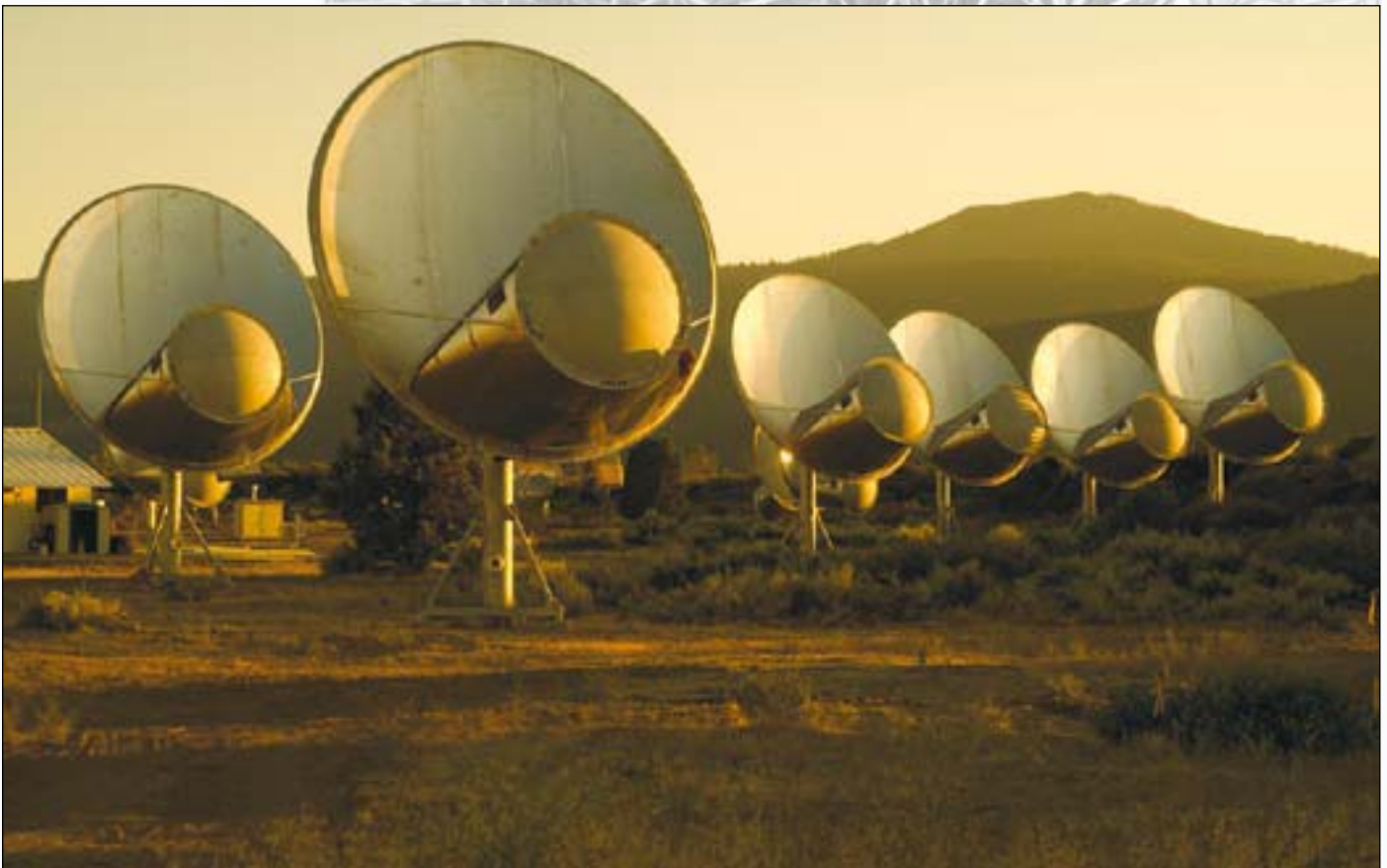
Abb. 3: Allan Telescope Array (ATA) in Kalifornien [5].

schen Katastrophen (z.B. Meteoriten) weitestgehend geschützt ist. Außerdem muss der Planet in der Lage sein eine entsprechende Chemie für Leben bilden zu können, wozu er genügend radioaktive Elemente besitzen muss, die einen Karbonat-Silikat-Zyklus am Laufen halten können. Dieser Zyklus bezeichnet in der Chemie einen geochemischen, zyklischen Wechsel von Silikaten zu Carbonaten (und umgekehrt) unter dem Einfluss von Kohlensäure bzw. Kieselsäure. Dadurch wird ca. 80% des Kohlendioxids in einem Zeitraum von mehr als 500.000 Jahren zwischen Gestein und Atmosphäre ausgetauscht. Damit dieser Zyklus entsteht, der als erste Grundlage für Leben vorhanden sein muss, muss der Planet sich innerhalb des habitablen Alters bilden. Dieser Zeitraum wird allerdings vom Urknall an bis heute und weiteren 10-20 Milliarden Jahren andauern. Nach Ablauf dieser Zeit werden wichtige radioaktive Elemente nicht mehr im ausreichendem Maße zur Verfügung stehen, weshalb