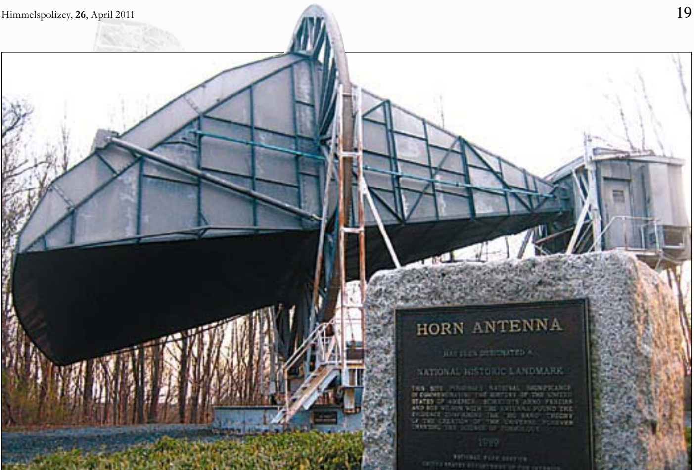
Abb. 7: Bell Labs Horn-Radio-Antenne in Crawford [14].

dem Entdecker bejaht. Leider waren damals weder das Radioteleskop noch die Computer leistungsfähig genug, um ein solches Signal entschlüsseln zu können. Letztendlich konnte aber auch nicht nachgewiesen werden, dass das Signal wirklich aus dem interstellaren Raum kam und nicht durch terrestrische Quellen verursacht wurde. Es bleibt aber eine sehr hohe Wahrscheinlichkeit über, dass es sich um außerirdisches Signal gehandelt hat.