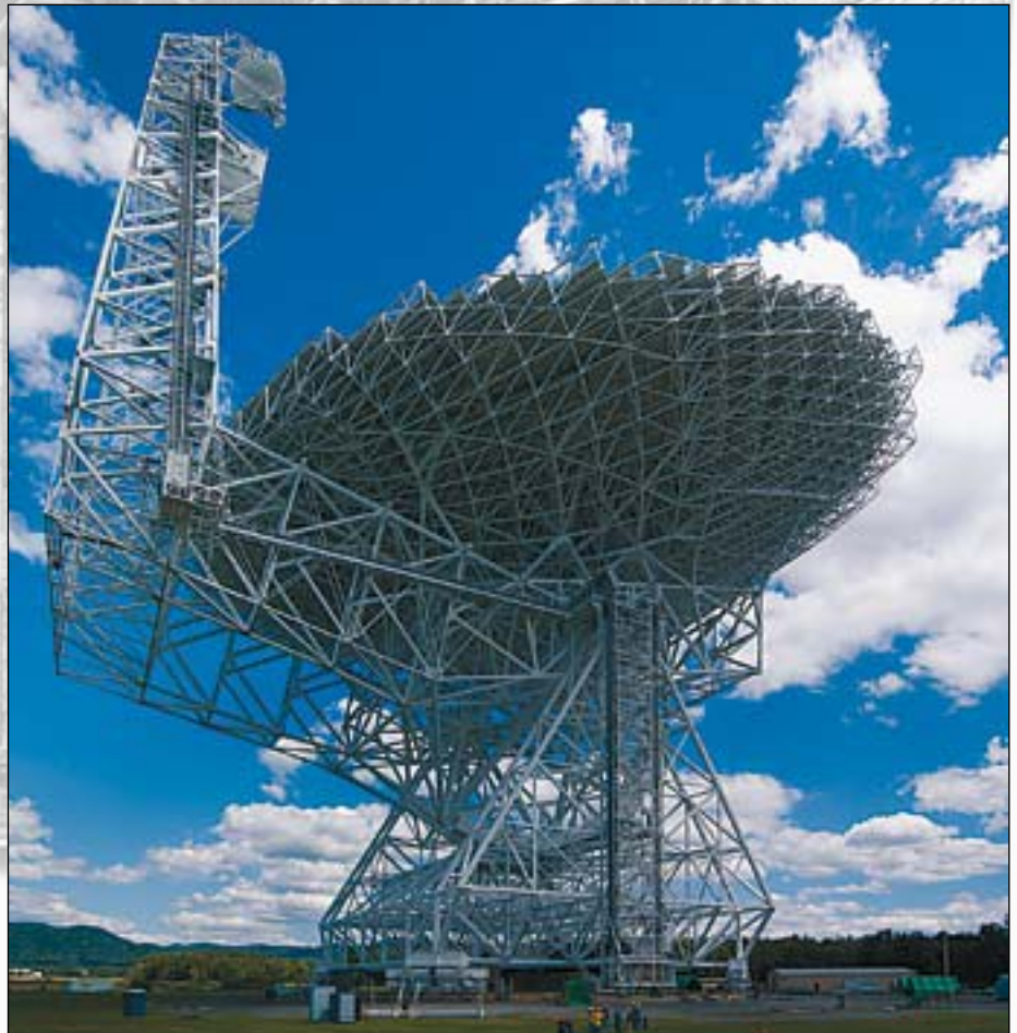
Abb. 1: Radioteleskop am Green-Bank-Observatorium [2].

Seit der Erfindung des Radios beschäftigen sich die Menschen mit der Möglichkeit, dass auch andere Zivilisationen ähnliche Entwicklungen geschaffen haben könnten und man diese Signale, wenn auch sehr schwach, auch empfangen könnte. Bereits der italienische Wissenschaftler Guglielmo Marconi, der 1909 zusammen mit dem deutschen Physiker Ferdinand Braun den Nobelpreis erhielt, stellte bereits 1922 fest, dass er außerirdische Radiowellen empfangen habe. Zwar konnte dies von keiner anderen Quelle bestätigt werden; trotzdem sollte man sich vergegenwärtigen, dass es sich bei Guglielmo Marconi nicht um einen Fantasten, sondern um einen anerkannten Pionier der drahtlosen Telekommunikation gehandelt hat. Er stand zeitlebens unter einem Erfindungsdruck und widmete sich hauptsächlich seinen Forschungen. So entwickelte er 1896 u.a. auch ein Gerät zur Aufspürung und Registrierung elektrischer Schwingungen, welches er im selben Jahr noch patentieren ließ. Hiermit hat er dann wohl auch