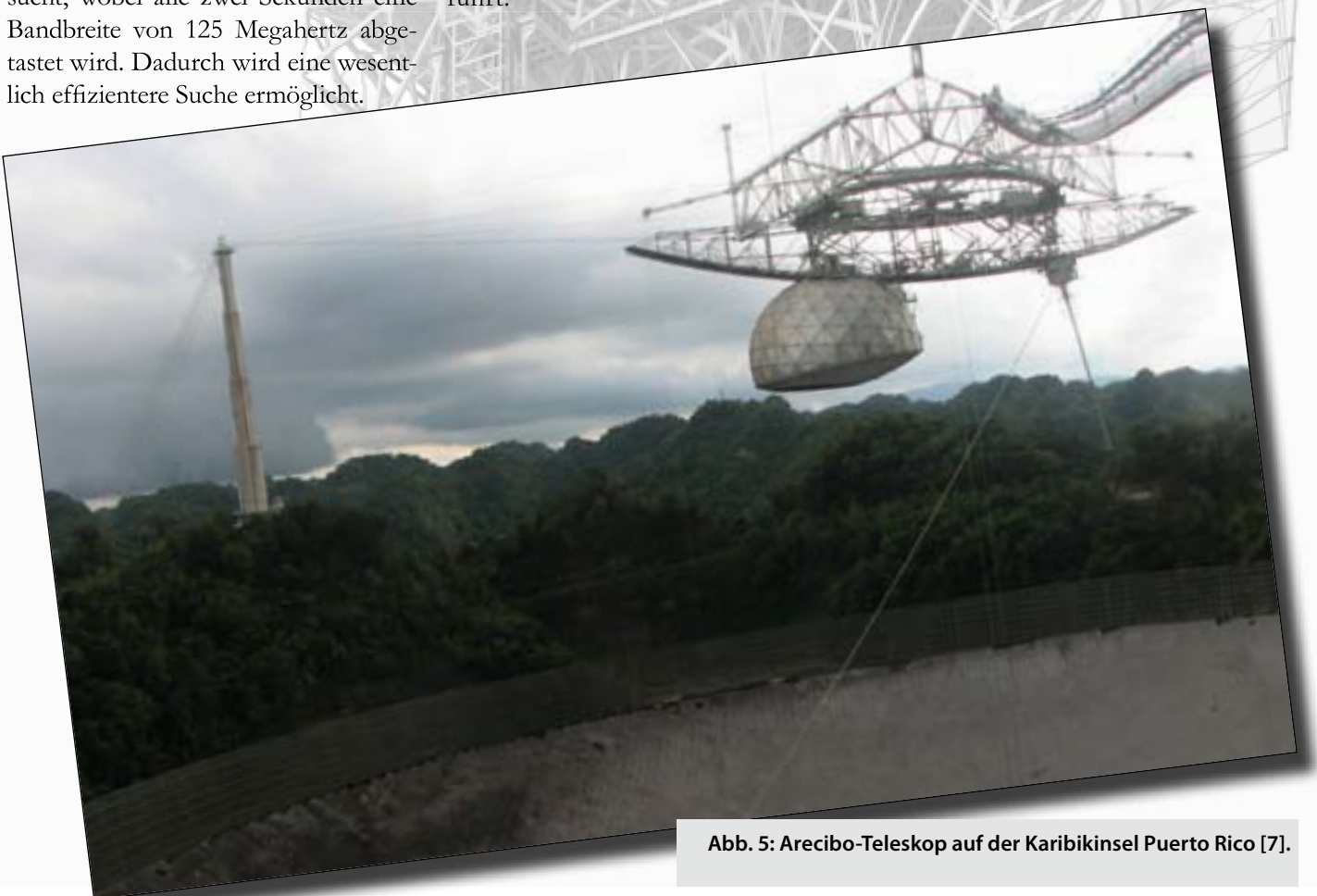
Abb. 5: Arecibo-Teleskop auf der Karibikinsel Puerto Rico [7].

Im Gegensatz zu den universitären Projekten, kann beim SETI@home-Projekt jeder mitmachen. Dies wird ermöglicht, wie bereits erwähnt, durch die Ausnutzung verteilter Rechenleistung im Internet. Jeder Benutzer kann seit 1999 ein entsprechendes SETI@home-Programm herunterladen und auf seinem Rechner installieren. Dieses Programm entnimmt die nicht benötigte Rechenleistung eines Computers und nutzt diese für SETI-Analysen bei geringster Priorität aus. Dadurch, dass heutige Rechnersysteme die meiste Zeit nur einen Bruchteil ihrer Leistung für die eigentlichen Aufgaben nutzen, ist dieser Ansatz entstanden. Nach Abarbeitung eines Datenpakets werden die Ergebnisse an den zentralen SETI-Server zurückgeschickt und mit den Ergebnissen anderer Computer kombiniert. Das Bildschirmschoner-Programm von SETI@home informiert jeden Benutzer über aktuelle Fortschritte (siehe Abb. 4).