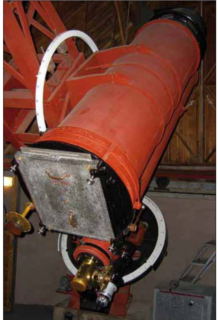
Abb. 5: Astrograph des Lowell-Observatoriums mit dem Pluto entdeckt wurde [1].

müsse, und er wich noch stärker von der realen Planetenbahn ab. Als Lowell im November 1916 starb, hatte er weder die Bahnberechnung noch die visuelle Entdeckung von Pluto erfolgreich abschließen können. Ein trauriges Schicksal für einen Mann, der halsstarrig immer wieder alles versuchte, um den neunten Planeten zu finden und dafür sein eigenes Vermögen opferte.