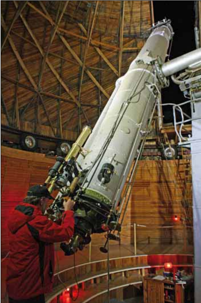
Abb. 4: Großer Refraktor des Lowell-Observatoriums zur Planetensuche