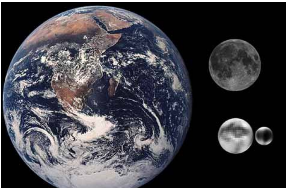
Abb. 1: Größenvergleich zwischen der Erde, dem Mond und Pluto mit Charon [1]

als die der anderen Planeten. Dies hat mich persönlich schon zu Schulzeiten gewundert, weshalb ich ihn schon immer als Sonderling unter den Planeten wahrgenommen hatte. Grundsätzlich ist Pluto so weit entfernt, dass er auf der Erde nur als 1/50 des scheinbaren Sonnendurchmessers wahrgenommen werden kann. Das heißt, ein Beobachter würde Pluto nur als Stern erkennen, wenn auch als ein recht helles Ex-