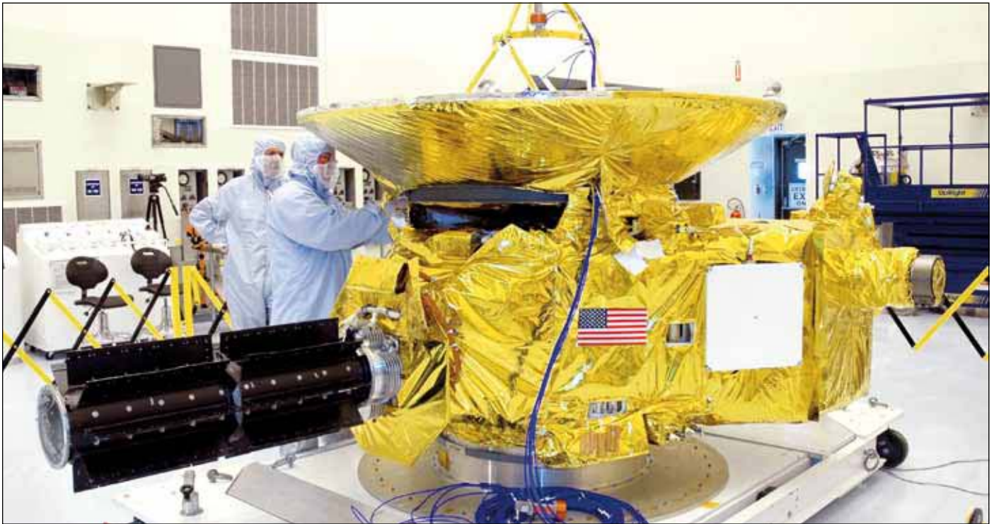
Abb. 7: Raumsonde „New Horizons“ bei der Endmontage [1]

Pluto Companion Search Team im Mai 2005 entdeckt. Weitere unabhängig voneinander gemachte Auswertungen von Hubble-Aufnahmen zeigten im August 2005 ebenfalls beide Trabanten von Pluto an. Ein Vergleich mit älteren Aufnahmen bewies zusätzlich, dass die Monde existierten. Fast ein Jahr später wurde im Juli 2006 von der IAU der Name Nyx 4 aus der griechischen Mythologie ausgewählt. Da allerdings bereits ein Asteroid diesen Namen besaß, wurde eine abweichende Schreibweise gewählt. Nyx umkreist Pluto in einer elliptischen Umlaufbahn in ungefähr 24 Tagen. Sein Durchmesser konnte bisher nicht eindeutig bestimmt werden. Er ist allerdings um 25% lichtschwächer als Hydra, was auf eine geringere Größe schließen lässt. Hydra 5 umkreist das Pluto-Charon-System ebenfalls in einer leicht elliptischen Umlaufbahn und umläuft Pluto in ungefähr 38 Tagen. Auch von Hydra konnte der Durchmesser bisher