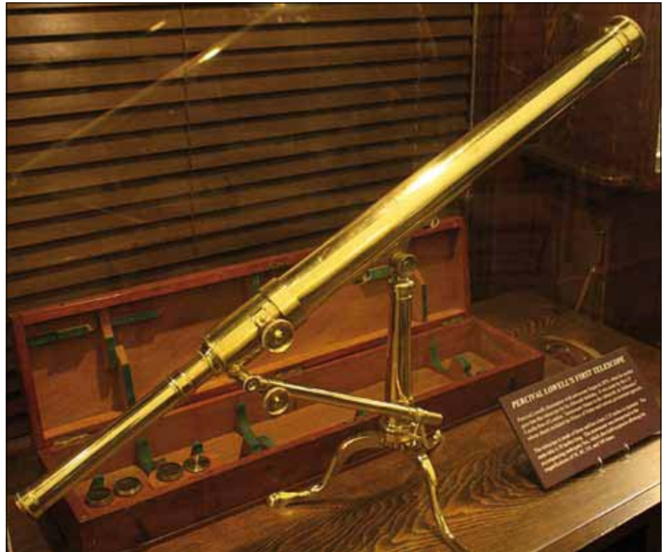
Abb. 3: Erstes Teleskop von Percival Lowell am Lowell-Observatorium

Aus diesem Grund versuchten die Astronomen George Biddell Airy, John Couch Adams (jeweils in England) und Urbain Jean Joseph Leverrier (in Frankreich) unabhängig voneinander das Objekt mathematisch zu finden. Allerdings waren dafür weder das vorhandene Kartenmaterial exakt genug, noch handelte es sich bei den drei Astronomen um ausdauernde Sternengucker. Deshalb schrieb Leverrier seinen Freund Johann Gottfried Galle in Berlin an, der seine Angaben visuell überprüfen sollte. Dieser machte sich mit einem 9“-Refraktor und der kurz zuvor veröffentlichten „Berliner Akademische Sternkarte“ von Carl Bre-