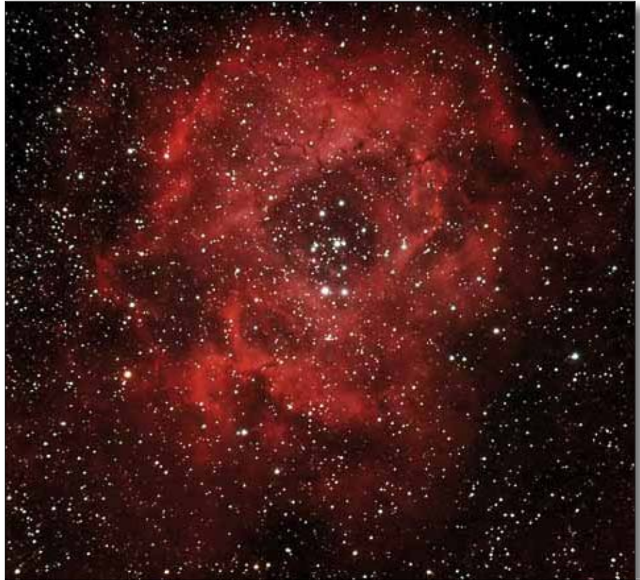
Abb. 3: Rosettennebel (NGC 2244) bei 420 mm Brennweite, 91 x 60 sec Bilder, Kamera Canon 1000Da.

Die Vorteile einer Montierung, die nur in einer Achse nachgeführt wird, liegen in den komfortablen, umfangreichen und präzisen Einstellungsmöglichkeiten sowie das daraus resultierende einfache Auffinden von Sternen. Allerdings kann es bei Nachführungen über den Meridian hinaus zum gefürchteten Umschlagen des Teleskops kommen. Das heißt, Objekte die über den Meridianandurchgang hinaus beobachtet oder fotografiert werden, führen früher oder später zu einem Zusammenstoß mit dem Montierungskörper. Um dies zu vermeiden, muss frühzeitig von der West- in die Ostlage umgeschwenkt werden. Zwar sind die meisten Deutschen Montierungen so konstruiert, dass die noch eine Weile über die Südposition des Objekts nachführen. Zudem ist eine parallaktische Montierung schwerer als eine Gabelmontierung, nicht so leicht auszurichten und schlechter transportabel. Während man eine Gabelmontierung inkl. des Teleskops meist bequem ohne Umbau in den Garten schleppen kann, muss bei der parallaktischen Montierung das Teleskop, die Gewichte und die Montierung sowie ggf. das Stativ einzeln transportiert werden. Auch bei der Poljustierung geht weitere Beobachtungszeit verloren. Daher ist sie schwerer handhabbar und gerade