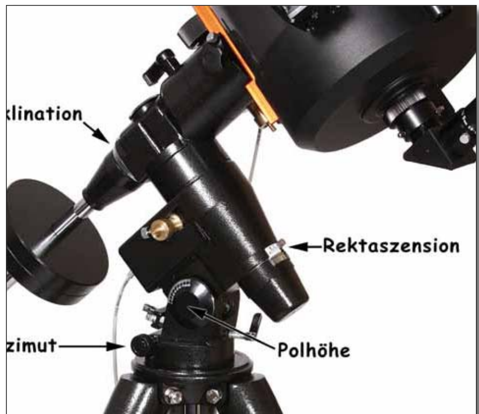
Abb. 2: Parallaktische Montierung eines SC-Teleskops [3].

Die parallaktische Montierung (siehe Abb. 2) ist von Haus aus für die Fotografie vorgesehen worden. Diese Montierungen ermöglichen, bei entsprechender Aufstellung, einem Himmelsobjekt nur in einer Achse zu folgen. Diese Achse muss hierfür parallel zur Erdachse ausgerichtet werden, was in den meisten Fällen durch die Hinzunahme eines Polsuchers geschieht, um den Polarstern für die Justierung zu nutzen. Eine Variante der parallaktischen Montierung ist die Deutsche Montierung. Sie wurde durch Josef von Fraunhofer hoffähig gemacht, der zu Beginn des 19. Jahrhunderts seine gebauten Teleskope mit dieser Montierung ausstattete. Der Teleskop-tubus wird hierbei an einem Ende der Deklinationsachse befestigt und