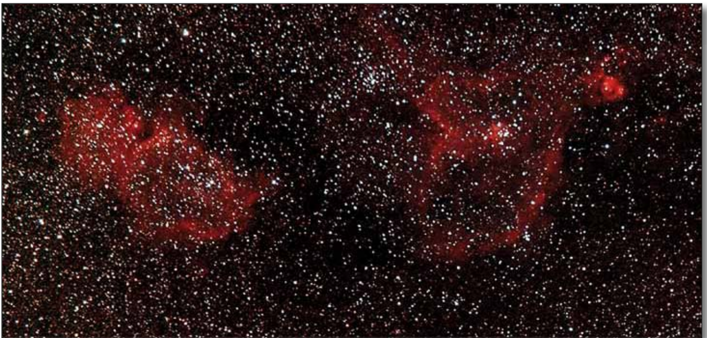
Abb. 6: Embryo- und Herznebel, AstroTrac, 124 mm Brennweite, Kamera Canon 1000Da.

die AstroTrac nur mit Teleobjektiven bisher genutzt habe, bei max. 200 mm Brennweite. Die max. Nachführzeit beträgt 2 Stunden, da dann die Spindel abgelaufen ist. Will man mehr Zeit für die Belichtung investieren, muss die Spindel zurückgefahren werden und erneut eine Neuausrichtung der Kamera begonnen werden. Um die Genauigkeit der Nachführung weiter zu verbessern, hat man neuerdings auch einen Autoguider-Anschluss eingebaut. Dieser ST-4-Anschluss ermöglicht das Autoguiding in Rektaszension über entsprechende Autoguides. Allerdings eben auch nur in dieser Achse, da die AstroTrac nur in einer Achse nachführen kann. Das heißt, man muss in jedem Fall eine genaue und exakte Ausrichtung auf den Polarstern vornehmen, unabhängig ob man den ST-4-Anschluss nutzt.