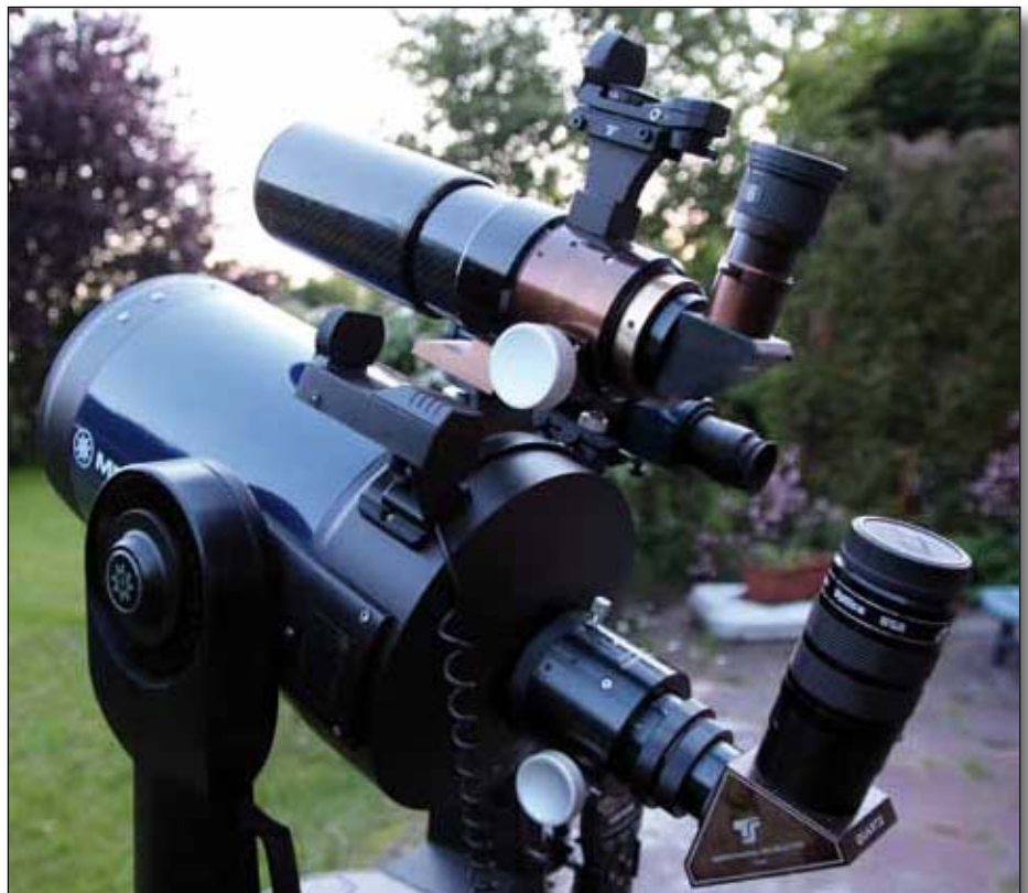
Abb. 1: SC-Teleskop mit azimutaler Gabelmontierung und aufgesatteltem ED70-Refraktor.

In der Ausgabe 29 der Himmelspolizey bin ich in dem Artikel „Lichtstärke in der Astrofotografie oder Brennweite ist nicht alles“ [1] bereits