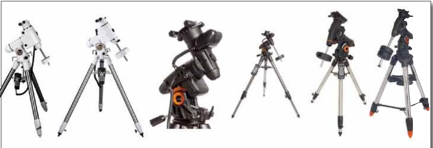
Abb.4: Schneckenradtriebmontierungen (EQ5, EQ6, AS-VX, CGEM, CGEM-DX).

informationen enthält, benötigt man insgesamt wesentlich weniger Aufnahmen, aber die gleiche Gesamtaufnahmedauer. Allerdings sortiert man schlechte Aufnahmen jetzt auch sehr ungern aus, da man dann gleich 10 oder mehr Minuten verlieren würde. Da aber eine genaue Nachführung durch die parallaktische Montierung vorgenommen wird, bei exakter Ausrichtung auf den Himmelspol und dem Auspendeln der Gewichte, kommt keine Bildfelddrehung mehr zustande. Dadurch lässt sich der gesamte Bildausschnitt verwenden und nicht mehr nur der mittlere Teil.