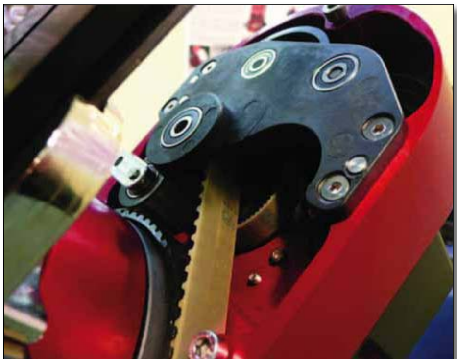
Abb. 7: Zahnriemenantrieb der Avalon-Montierungen [9].

Hobbyastronomen sind heute oftmals nach wie vor der Meinung, dass azimutale Montierungen ausschließlich zur visuellen und parallaktische Montierungen zur fotografischen Nutzung geeignet sind. Wobei die letztere Montierung beide Anwendungsfälle ausfüllt, aber schlechter transportabel bzw. schwerer beherrschbar ist. Diese Regel hat sich aber spätestens seit der Videoastronomie mit Planeten-, Sonne- und Mondfotografie überholt. Zusätzlich kommen immer leistungsfähigere und empfindlichere DSLR-/CCD-Kameras auf den Markt, die bei immer kürzerer