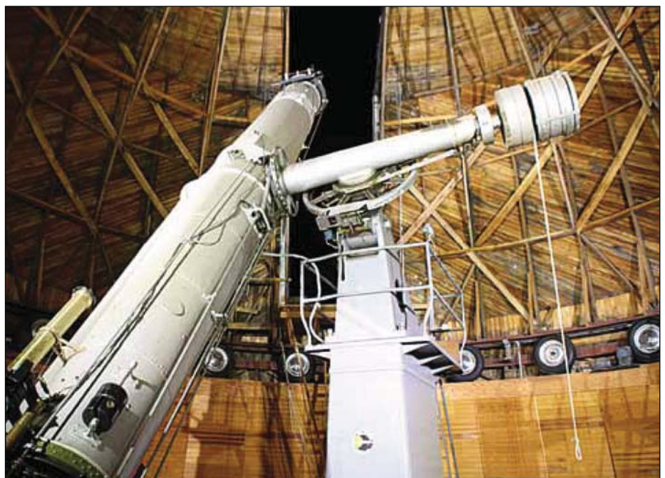
Abb. 2: 61-Zentimeter-Refraktor im Lowell-Observatorium

Auf dem Gelände haben auch Hobbyastronomen ein Schmidt-Cassegrain-Teleskop aufgebaut sowie einen Dobson. Durch beide Geräte durften wir durchsehen. Durch das SC-Teleskop bei 100facher Vergrößerung