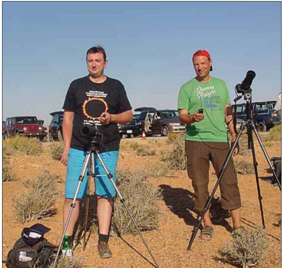
Abb. 7: Es kann losgehen - das AVL-Equipment ist startbereit

Als die Sonne nur noch knapp über der Bergkette steht, schraube ich den Sonnenfilter ab und mache zusätzlich Dämmerungsfotos, die das Bild in ein rötliches Licht tauchen. Auch Stimmungsbilder müssen jetzt mal sein. Zufrieden packen wir am Ende der SoFi unsere Geräte ein. Wobei ich es mir nicht nehmen lasse und noch ein paar Aufnahmen der Venus schieße, die in der Dämmerung gerade gut zu