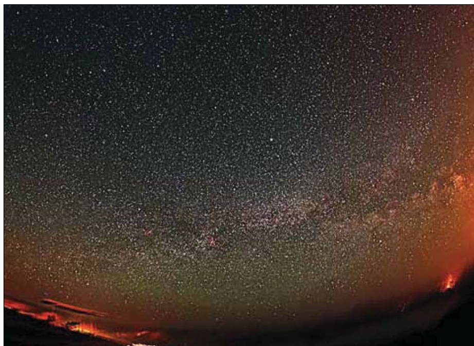
Abb. 5: Blick auf Page, 16 Aufnahmen mit Canon 1000Da á 30 sec, 800 ASA

cherlich auch am Tag einen schönen Blick auf Page ermöglicht. Es ist sehr windig und daher auch relativ kalt. Ich baue meine Kamera im Windschatten des Wagens auf und mache meine erste Probeaufnahme mit dem Fisheye. Die Sicht ist nicht berauschend, man kann aber immerhin die Milchstraße erkennen. Die erste Testaufnahme ist trotzdem vielversprechend. Ich stelle den Timer auf 10 Aufnahmen und geselle mich zu Peter und Alexander, die gerade den Sternenhimmel nach verschiedenen Himmelsobjekten absuchen. Den OWB-Astronomik-Filter [4] habe ich vorher entfernt, so dass die Kamera auf maximale Empfindlichkeit eingestellt ist. Da wir nach ca. 15 Aufnahmen, die mit automatischem Dunkelbildabzug durchgeführt werden, anfangen zu frieren, treten wir den Rückzug an. Am nächsten Abend versuchen Alexander und ich noch einmal unser Glück und haben mehr Erfolg. Der Himmel ist klarer geworden und der Wind ist kaum noch vorhanden. Dieses Mal wähle ich eine Serie von 20 Bildern mit einer ISO-Empfindlichkeit von 800 ASA, bei ebenfalls 30 s pro Bild. Über Page steht der Skorpion und schaut auf uns herunter, so wie er bei uns nicht zu erkennen gewesen wäre. Ein schöner Abend.