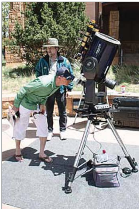
Abb. 4: Sonnenbeobachtung am Bryce Canyon vor der Touristik-Information

wie z.B. T-Shirts drucken lassen. Bei den Teleskopen ist unter anderem ein Meade LX200 mit ca. 12“ Öffnung aufgestellt worden, welches auch verschiedene Coronado-Sonnenfernrohre aufgesattelt bekommen hat. Dadurch kann man die Sonne sowohl im Weiß- als auch im H-Alpha-Licht betrachten. Ich schaue mir durch einen angebrachten Binoadapter die Sonne im Weißlicht mit beiden Augen an und kann verschiedene Sonnenflecken erkennen, die recht gut durch die Sonnenfilterfolie herausgearbeitet werden. Der Anblick durch die Sonnentelkope im H-Alpha-Lichtbereich enttäuscht mich allerdings etwas; hier fehlen mir die Details, die ich noch im Weißlicht erkennen konnte. Trotzdem war das mal ein schöner Auftakt. Ich frage den Besitzer noch, wie er die Sonne nachverfolgen kann, da diese aus Sicherheitsgründen nicht im Goto-Computer von Meade enthalten ist. Über eine leichte manuelle Anpassung hat er dies soweit hinbekommen, dass er nur alle 10 min nachregeln muss. Das ist immerhin besser, als ich dies bisher geschafft habe. Später recherchiere ich dann ein bisschen und finde heraus, dass Richard Seymour sich geholfen hat, indem er die Sonne als eigenes Asteroiden-Objekt in der Datenbank von