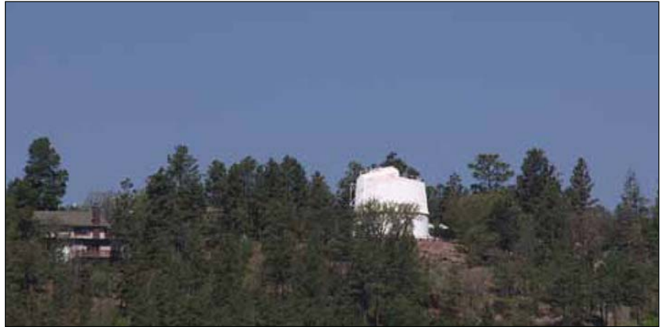
Abb. 1: Lowell Observatorium in Flagstaff, Arizona

Percival Lowell hat das Observatorium aus eigenen Mitteln 1894 erbauen lassen und seine Forschung sehr intensiv betrieben. Seine größte und bekannteste Entdeckung ist im Jahre 1930 nach jahrzehntelangen Vorarbeiten die des Zwergplaneten Plutos. Aber auch den Mars hat er sehr aufmerksam studiert, um die von Giovanni Schiaparelli 1877 bis 1879 beobachteten