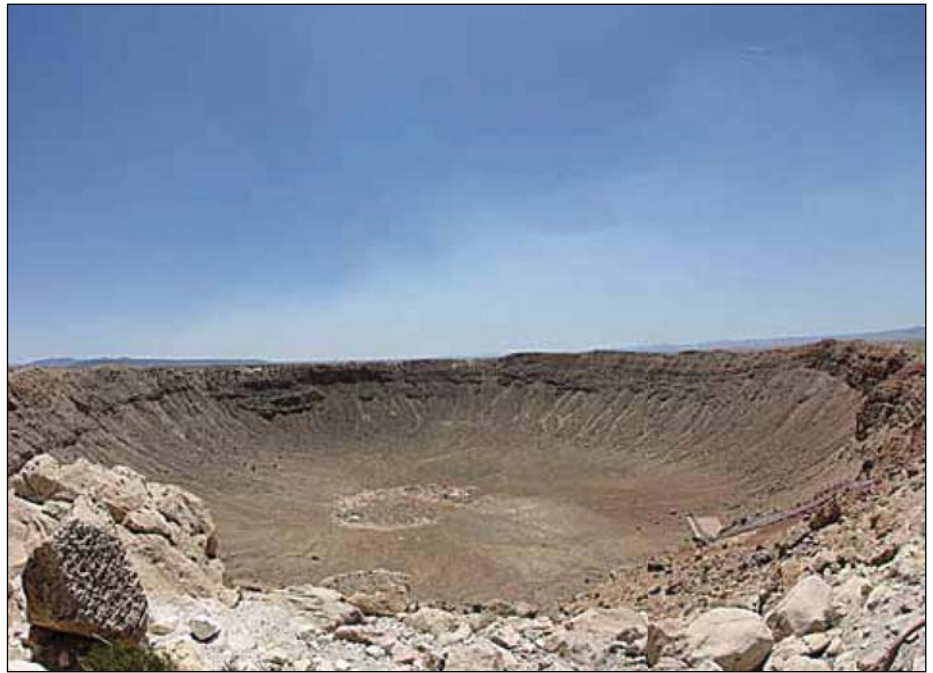
Abb. 3: Barringer-Krater im Coconino County, Arizona, Vereinigte Staaten

Nach einem Frühstück, das hauptsächlich aus Weißbrot und Marmelade bestand, geht es erst einmal in den Ort Flagstaff, um diesen genauer zu erkunden. Bis auf den Bahnhof und ein paar nette Seitenstraßen ist allerdings nicht viel zu sehen, weshalb wir beschließen, uns auf den Weg zum Meteoritenkrater (Barringer-Krater) zu machen. Dieser liegt einige Meilen von Flagstaff entfernt, ist aber durch eine sehr gut ausgebaute Straße leicht zu erreichen. Der Krater selbst ist schon beeindruckend.