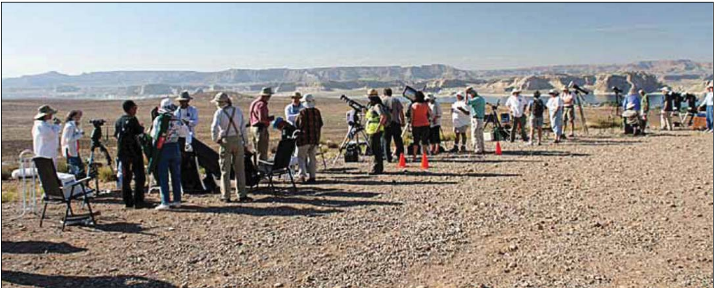
Abb. 6: Sonnenbeobachter finden sich ein und bauen ihre Gerätschaften auf