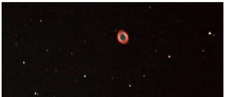
Abb 7: Ringnebel (M57), mit Canon 1000Da, 1.600 ASA, 7 Aufnahmen mit 60, 90, 120 s

wir im Deep-Sky-Umfeld benötigen. Im Gegensatz dazu besitzt die 550D eine höhere Auflösungstiefe (14 Bit statt 12 Bit), was bei Deep-Sky-Aufnahmen aber so gut wie gar nicht ins Gewicht fiel und bei Mondaufnahmen sich nur sehr gering positiv auswirkte.