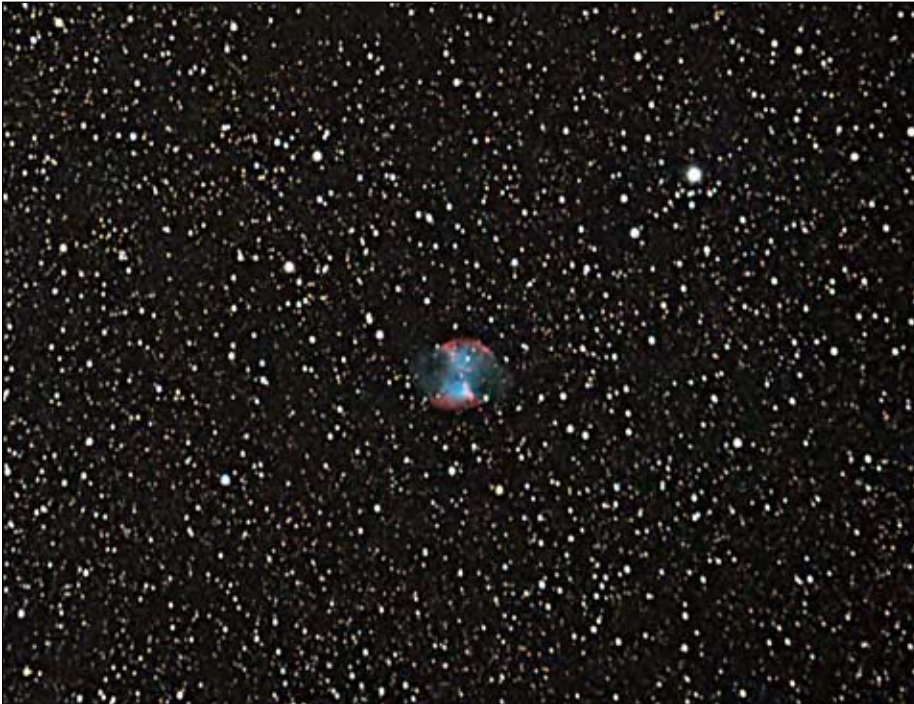
Abb. 6: Hantelnebel (M27) mit Canon 1000Da, 800 ASA, 40 Aufnahmen á 60 s

von mir südlich vom Yosemite-Nationalpark in den USA aufgenommen wurde. Es besteht aus 10 Bildern, die jeweils mit 15 s belichtet wurden. Es kam dabei das Takumar-Objektiv (Brennweite: 55 mm, Blende: 1,8) bei stehender Kamera zum Einsatz, welches mit einer Canon-Kamera 1000D (unmodifiziert) genutzt wurde. Als ISO-Wert wurde 800 ASA gewählt.