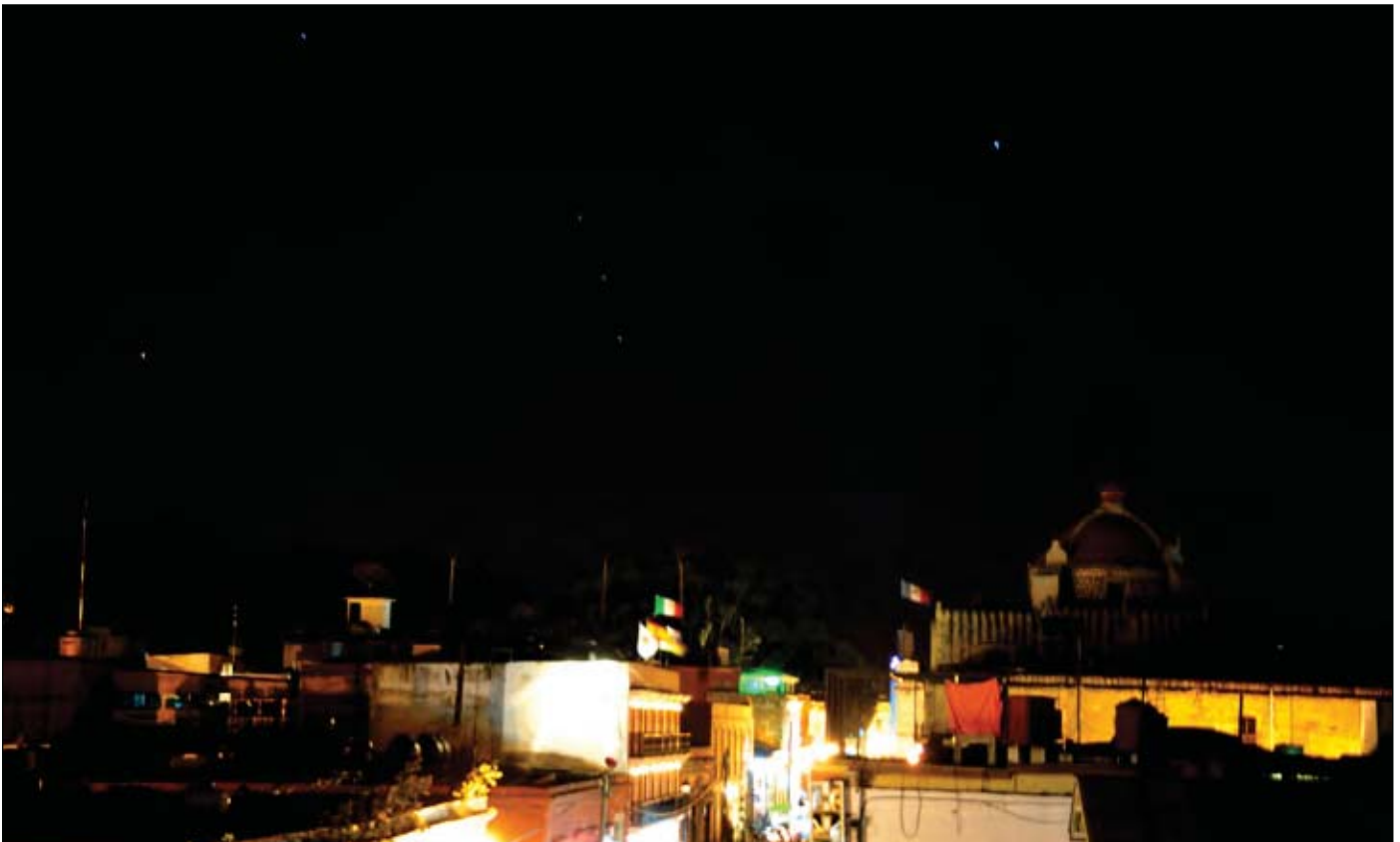
Orion-Aufgang über Oaxaca / Mexiko