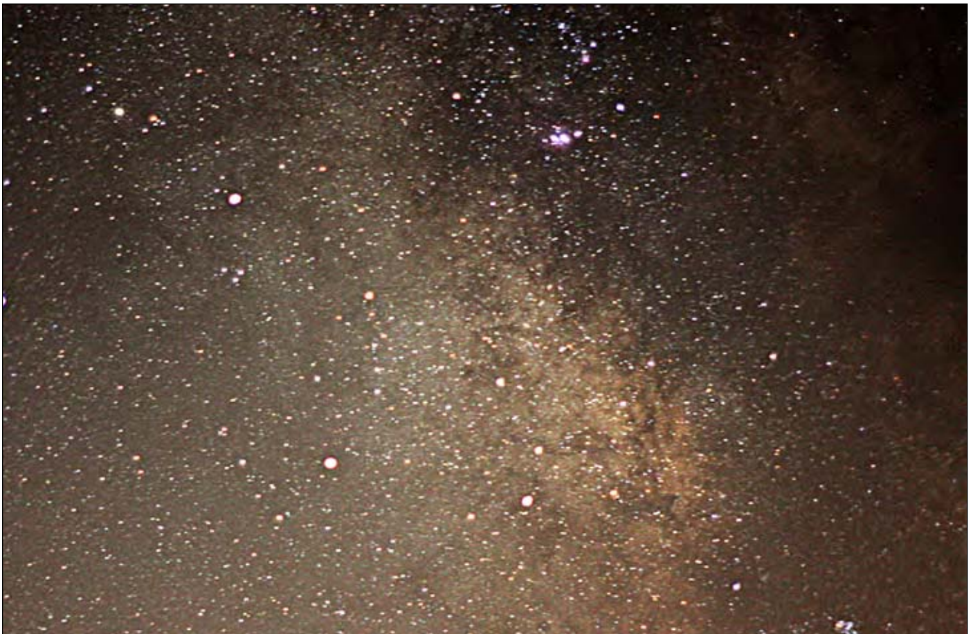
Abb. 3: Milchstraße, mit Canon 1000D, 800 ASA, 10 Aufnahmen á 15 s