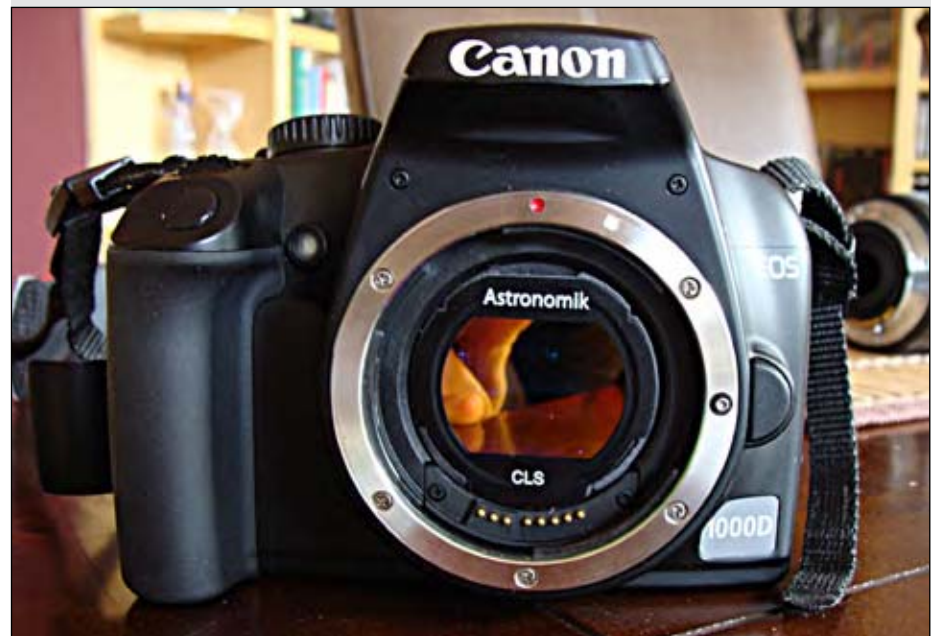
Abb 5.: Umgebaute DSLR-Kamera 1000D mit Astronomik CLS-Filter

desto schwieriger wird es, dieses zu belichten. Bei Kameraobjektiven wird die Lichtempfindlichkeit durch die Blendenzahl angegeben, während bei Teleskopen das Öffnungsverhältnis entscheidend ist. Beide Werte sagen aus, wie hoch die Lichtempfindlichkeit ist. Bei Kameraobjektiven bestimmt die Blende, oftmals auch den Preis. Lichtempfindliche Objektive sind aufwändiger gebaut und daher teurer in der Anschaffung. Typische Werte liegen bei ei-