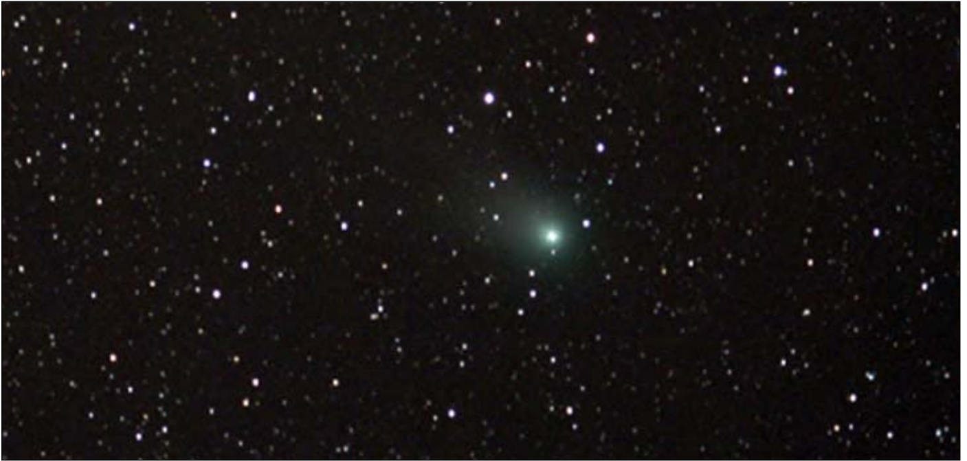
Abb. 8: Komet Gerradd (C/2009 P1), mit Canon 1000Da, 800 ASA, 26 Aufnahmen à 60 s

Eine weitere Schwäche für die Astrofotografie ist bei DSLR-Kameras der eingebaute IR-Sperrfilter. Dieser schneidet relativ viel vom roten Lichtbereich ab, so dass z.B. Nebelregionen schlecht abgebildet werden können. Auf Kugelsternhaufen oder Mondfotos wirkt sich der IR-Sperrfilter nicht negativ aus. Abhilfe kann nur durch einen operativen Eingriff in die Kamera, also durch einen Wechsel des eingebauten Filters, geschaffen werden. Dadurch erhöht sich die Empfindlichkeit im wichtigen H-Alpha-Bereich um ein Vielfaches. Bei dem Wechsel des vorhandenen IR-Sperrfilters stand zusätzlich für mich fest, dass ich auch weiter gerne mit der Kamera bei Tageslicht fotografieren möchte. Normalerweise wird nach einem solchen Umbau durch einen manuellen Weißabgleich ein entsprechender Farbausgleich hergestellt. Dies funktioniert aber nicht immer zufriedenstellend. Deshalb kam für mich nur die Clip-Filterlösung von Astronomik [8] in Frage. Hierbei wird ein anderer UV-IR-Sperrfilter in die Kamera eingebaut und ein OWB 6 -Clip-Filter kann manuell in die Gehäusefassung gesetzt werden. Das ist ein Korrektur-Filter für umgebaute