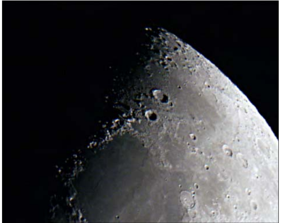
Abb. 4: Mare Serenitatis, mit Canon 1000Da, CLS-Filter, 800 ASA, 1/80 s Belichtung

erfasst und an den am anderen Ende befindlichen Okularauszug direkt weitergibt, d.h. das Licht wird nicht abgelenkt. Linsenteleskope besitzen den Nachteil, dass sie verschiedenfarbiges Licht nicht im selben Brennpunkt fokussieren können. Dadurch entstehen farbige Säume um helle Objekte, die umso störender sind, je größer die Teleskopöffnung bzw. das Öffnungsverhältnis ist. Um diesen Fehler zu vermindern, bestehen die meisten Amateurfernrohre aus zwei Linsen verschiedener Glasarten (Achromate), die es ermöglichen, dass zumindest zwei Farben im selben Punkt fokussiert werden können. Um drei Farben im selben Fokus zu halten, sind drei oder vier Linsen notwendig (Apochromat). Dadurch wird der Farbfehler auf ein